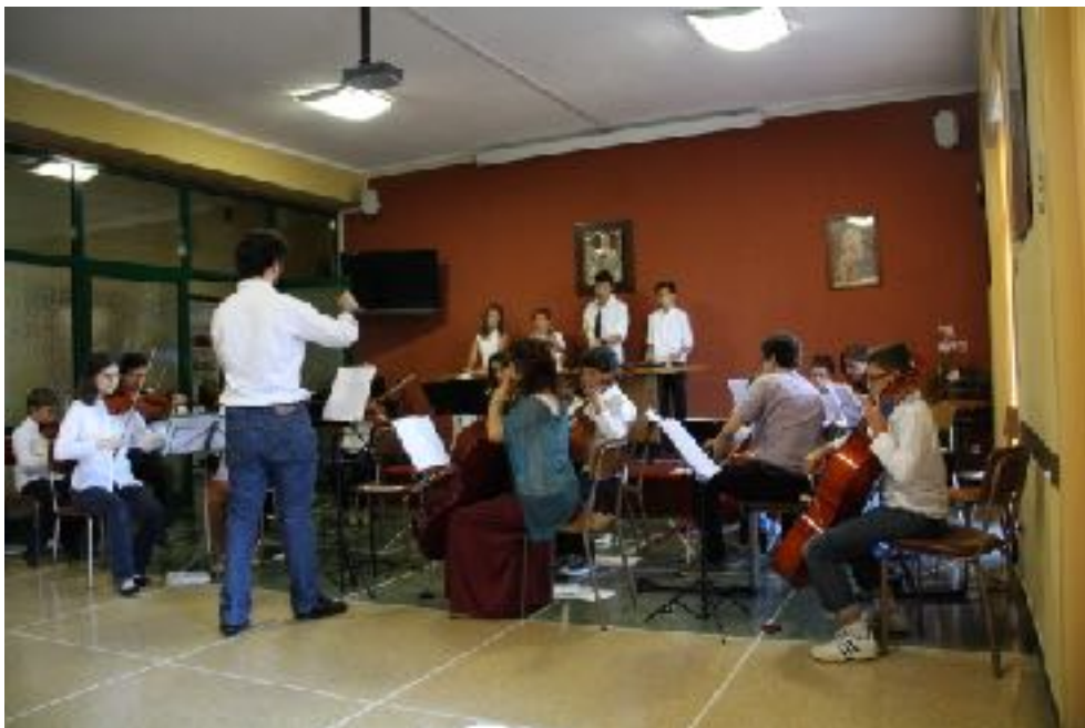
Il concerto finale del Campus 2014

Presenteremo tutti i dettagli del programma in una riunione dedicata venerdì 19 maggio alle 20,30 alla quale siete tutti invitati.